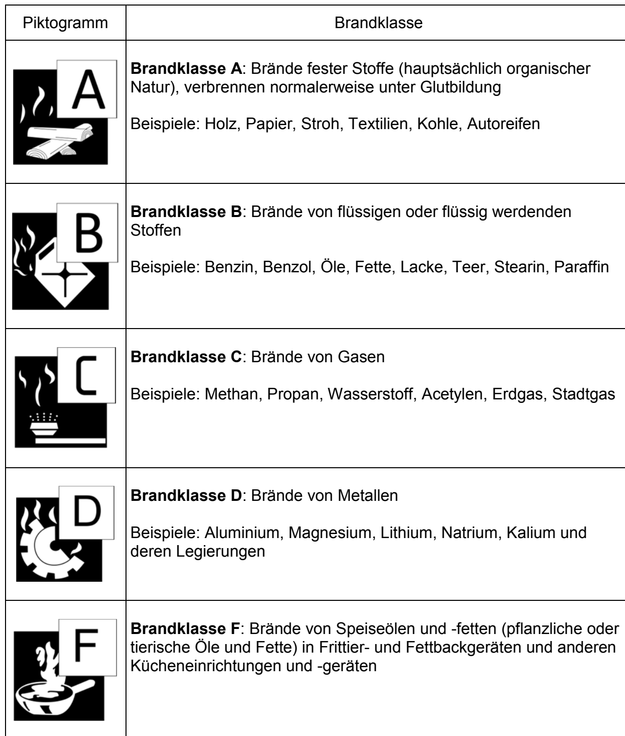
Tabelle 1: Brandklassen nach DIN EN 2 „Brandklassen“ Ausgabe Januar 2005